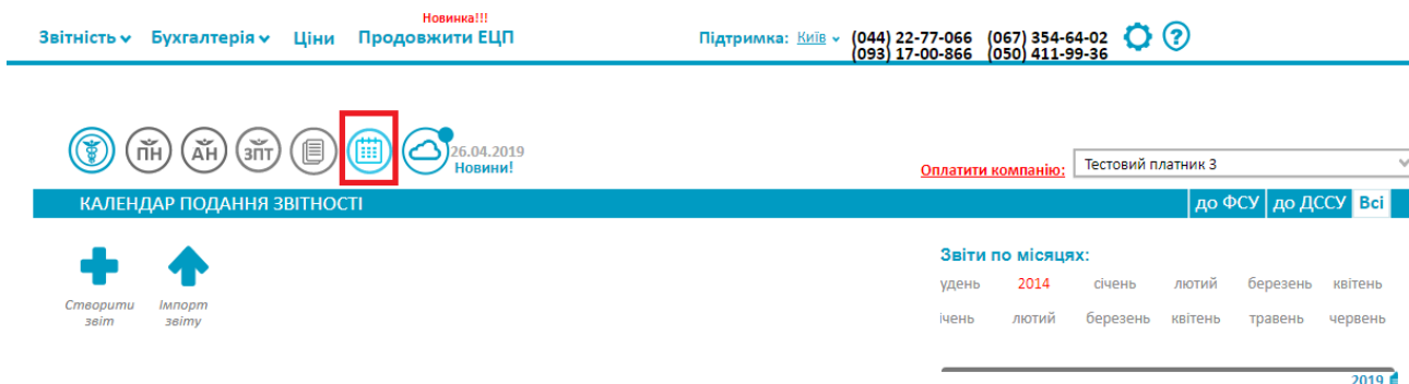
Рис. 1 Розділ «Звітність»

Для того, щоб розпочати роботу з розділом необхідно натиснути на символ календаря на головній сторінці розділу «Звітність»: